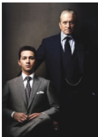
在《华尔街》的最后,道格拉斯因不法交易被判入狱,《华尔街2》的故事就从他出狱讲起。经

23年前迈克尔·道格拉斯主演的电影《华尔街》,展现了华尔街的权钱、美色、内线交易,该片上映后在全球观众中获得好评。《华尔街2:金钱永不眠》是《华尔街》的续集,但《华尔街》中花了大力气铺陈的“经济”,在续集中只是背景。