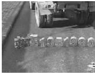
最有创意的小广告