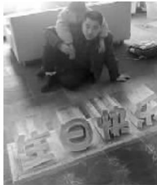
粉笔帝的得意之作