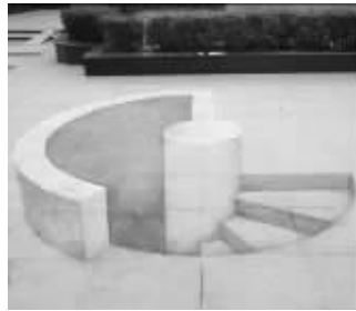
这难道是立体广场?