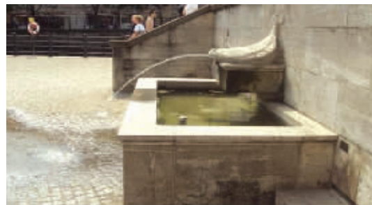
这设计师,够拉出去枪毙5分钟