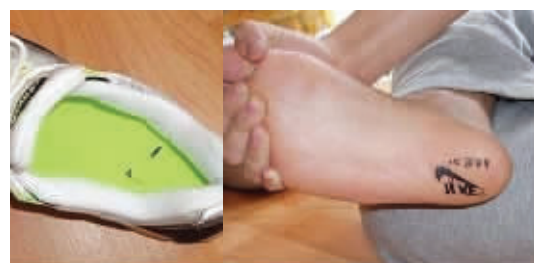
这鞋肯定是山寨的,还用说么