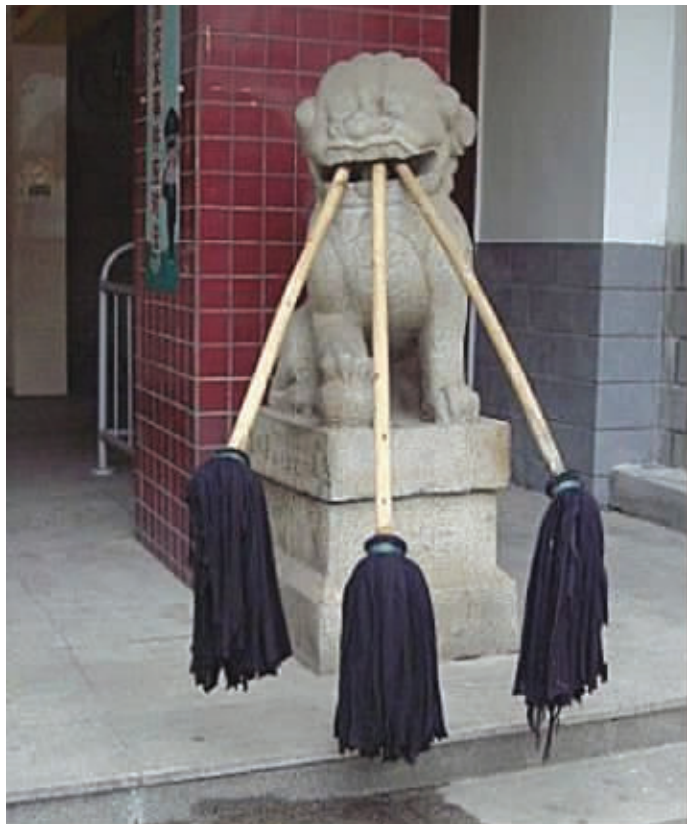
沦落至此,眼神怎能不哀伤无奈