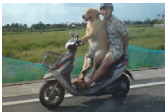
阳光明媚的午后,带着主人去郊游