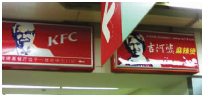
肯德基爷爷在中国找了个媳妇