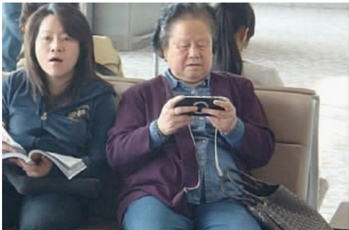
跟上潮流,不只是年轻人的专利