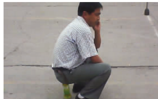
武林中人,只需一个支撑点就能恢复体力