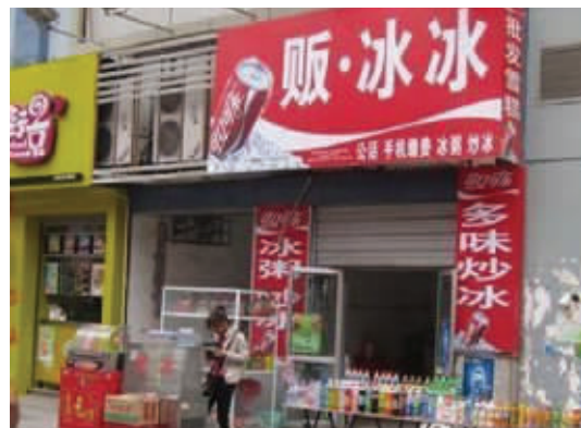
范冰冰对此表示泪流满面