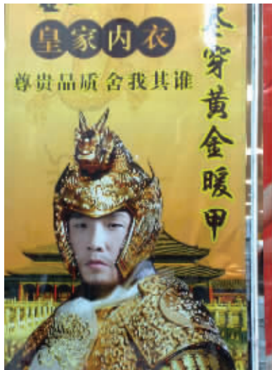
山寨的周董,山寨的内衣