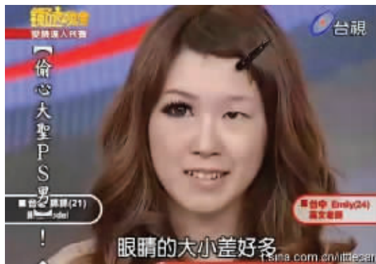
大眼美女神马的都是浮云而已