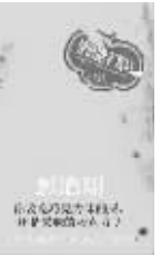
2010年10月 彭浩月著 人民美术出版社

本书内容涉及爱情辅导、性教育、心理治疗、文字辛辣,前卫,已被网络媒体及电影公司洽购改编版权,计划以其内容改编成同名单元式网络感情节目及电影。