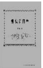
2010年10月 韩浩月著 新星出版社

《看戏节目单》为上世纪八十年代后期至今的国内外经典戏剧的回顾总结,从上千份节目单中精选近百场戏,每篇文章配有看戏时的门票或海报,是一本具有鲜明时代风格的私人戏剧读本。