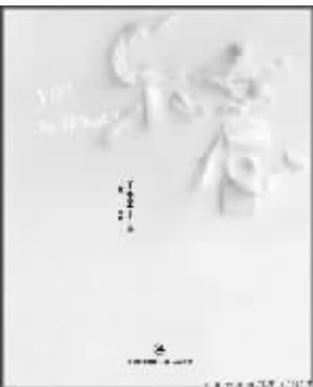
2010年10月 王小柔著 上海人民出版社

读王小柔的《乐意》时顺便瞅了几眼周立波的《谈新闻》,觉得这种扎根于生活的“脱口秀”,真能把人逗得乐不可支。不过,地域的区别也会导致言语底色与方式有所不同,如调侃房价,周立波说:“因为高房价问题而使一个名词爆热:蜗居。我觉得很不合适。蜗牛属于坐地户,一出生就有了一套房子,多幸福啊!”而王小柔以朋友两口子女为例,咬着牙花高价,“住着花园洋房,假老外似的,前些日子要把狗给我,说养不起,俩人整天哭穷就把把小区里草根挖出来吃了。”周立波自有一种上海小开的派头,娱乐大家的时候也带着西装笔挺,实际中分油光可鉴的范儿;王小柔则不然,素面素服地逗眼儿,天津杨柳青年画似的世俗喜庆劲儿,“砸挂”着别人,也毫不吝啬地拿自己开涮。