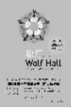
2010年10月 希拉里·曼特尔著 上海译文出版社

2009年布克奖获奖作品。小说以克伦威尔的生平与亨利八世的宫廷生活为主线,两线交织,编织了一张反映16世纪初英格兰政治、宗教及经济图景的巨网。暗潮汹涌的宫廷斗争,风雨欲来的宗教改革,迭起的战事和瘟疫,小气气势宏大的同时,情节生动好看。