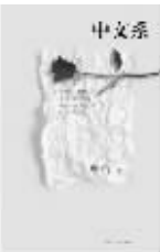
2010年10月 李江舒著 上海文艺出版社

小说以上世纪九十年代的大学生活为背景,对大学生生活、体制以及大学生内心进行了细致的剖析。书中呈现的心灵生活可能正是读者经历过的。