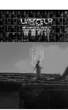
2010年10月版 陈庆港著 江苏文艺出版社

“每一段回忆,都是一块拼图。”这是一个关于爱的故事,爱永无止境,但我们的生命却有限,所以我们只能将自身的故事当做一块碎片,去拼凑着爱的全貌。所以,抹去时间与空间的界限,吕西安的故事就是安娜与克莱尔父亲的故事,如此我们就能明白他的沉默与孤僻是为了什么,他对自己的女儿又是心存怎样的深情。而安娜与克莱尔的际遇,则是吕西安那一对女儿的故事,我们能大概看到,父亲离开之后,她们将如何迎面撞上姐妹之间情感的暗礁。