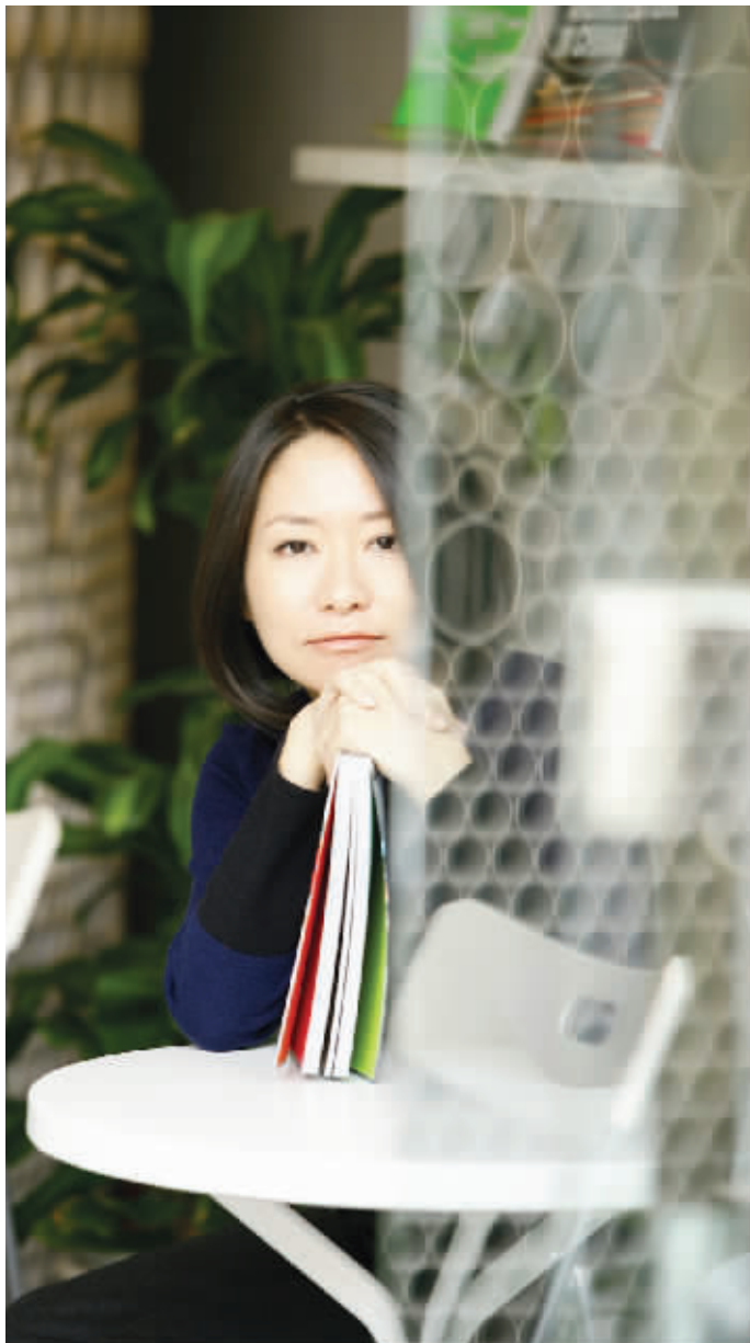
李欣频:创意不是让艺术走进生活,而是让我们走进艺术

南京重点文化产业项目河西第壹区明年即将与市民见面。这块拥有美术馆、书店、影城、酒店、商业街等诸多文化休闲设施的街区,自诞生之初便名家云集。第壹区的主要组成部分——艺兰斋美术馆的设计出自黑川纪章的手笔,这位大师级的建筑师一生在世界各地设计了27座美术馆,艺兰斋是他的封笔之作。第壹区的其他建筑则由世界知名的前卫建筑设计师荷兰的雅科布亲手打造。10月13日第壹区又迎来了台湾“创意天后”李欣频。李欣频希望从第壹区开始,南京能够成长为一座充满创意的城市。