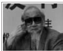
【故宫帝后玉玺】文化总顾问:国学大师、书法家、文学家文怀沙先生