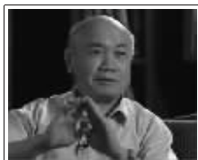
【故宫帝后玉玺】总设计师:故宫博物院原副院长杨新先生

玉价格的升值压力,收藏者对和田玉【世博双玺】的涨价预期高涨,【世博双玺】发行配额严重紧张,预计世博双玺将进入“白热化”阶段。预计本轮上浮在1000元左右,在此提醒已收藏世博双玺的收藏者在转手时注意关注。