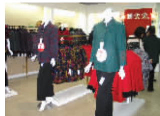
新百妙彩、山百福太太主要针对中老年人,在颜色和款式上都有很多创新