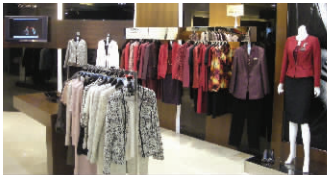
中央商场的品牌罗德斯兰很受中老年人欢迎

一位在南京百货业工作多年的“老百货”告诉记者,老年客层一直是被商场“漠视”的群体,“你看六一儿童节、三八妇女节时商场的促销活动办得多火热!但是重阳节针对这个主题制定促销计划的商场没几个,就算有,促销活动的力度也很有限。”昨天上午,记者来到湖南路一家百货商场,发现商场内没有与重阳节相关的活动吊牌。商场的相关负责人表示,“我们是一家定位为年轻时尚的百货商场,所以没有特别针对敬老节做活动。只是有部分专柜根据商品特点和老年人消费需求搞点优惠活动。”记者走访了多家百货商场,发现针对重阳节做活动的商场很少。新街口另一