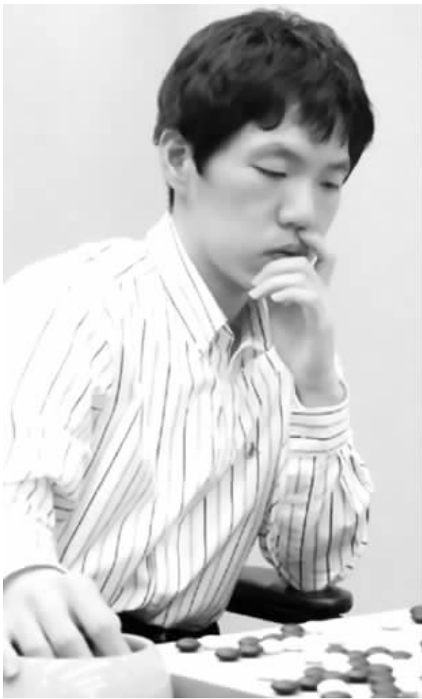
快结婚了,难怪李昌镐不在状态

昨天,第15届三星杯世界围棋大师赛16强战在韩国结束。包括古力、孔杰在内的5名中国棋手出战有3人晋级八强,这其中孔杰战胜了李昌镐,这盘棋李昌镐对待胜负表现出的麻木令人吃惊。