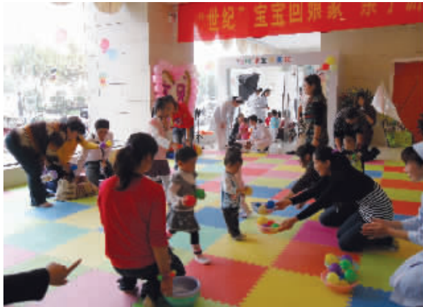
图为宝宝们正在欢快地游戏

宝宝的娘家在哪里?既不是外公外婆家,也不是爷爷奶奶家,而是在他们出生的医院里。10月10日,出生在南京世纪现代医院的近百名宝宝共聚一堂,一起“回娘家”,热闹欢畅的现场让宝宝们玩得乐此不疲。据悉,回娘家的宝宝们天真可爱的现场写真照片将在网络一一呈现,并通过网友的票选产生3名“明星宝宝”。