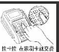
拉卡拉 在家刷卡就交费