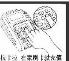
拉卡拉 在家刷卡就充值