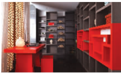
中国红搭配沉稳大气的黑,庄重又不失时尚

时空流转,设计风向也在不断地变化。2010年秋天,当国际大牌都在忙着发布它们最新的作品时,中国家居品牌中的创意代表科宝博洛尼,也指出了未来家居设计的流行风向:中国的,世界的!