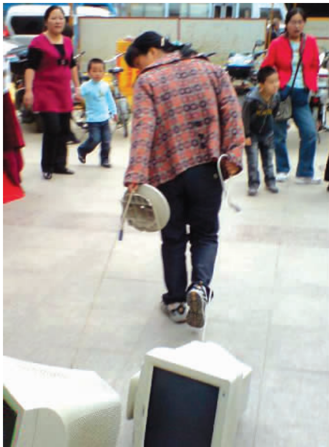
搬不动,干脆就遛着走。摄于珠江路 (作者冷先生获30元话费)