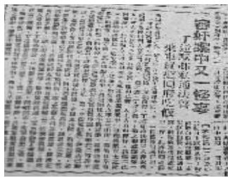
1946年10月13日，《中央日报》第四版刊登了汉奸丁默邨10月11日神秘失踪两个半小时的新闻