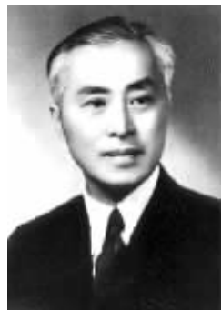
陈立夫晚年的回忆录中，关于丁默邨之死的细节，可能有讹误

根据《中央日报》上的报道，丁默邨是在1947年2月8日被判处死刑的，按照当时国民政府肃奸的态度，许多汉奸被判死刑后，十天左右，顶多一月之后，就会被执行枪决，然而，丁默邨一直到这一年的7月5日下午，才在老虎桥监狱刑场被处死，时间长达五个月，这其中，肯定是有隐情的。那会是什么呢？如果陈立夫记得丁默邨的死确实和一次外出有关的话，那么，深陷牢狱的丁默邨究竟有没有外出的机会呢？