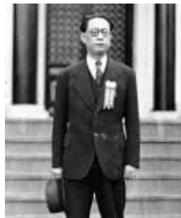
丁默邨试图效仿周佛海(如图)，用自己的身体做文章，以逃脱死刑，却无济于事

“审判丁默邨时，这两起案子受害者的家属都进行了起诉。郑苹如的妹妹、小弟，郁华的妻子都递交了诉状。而丁默邨的死刑判决书更是将其恶行一一陈述。他不死不能平民愤。”张翰林说。南大法学院李文军博士亦认为，在丁默邨被以汉奸罪审判时，所有构成汉奸罪的持续性行为已在其中，但郑苹如案和郁华案受害人亲属的新的起诉，法庭受理后着手调查，如果先前并没有将这两案包括进去，就会使整个丁默邨案审理的期限增加，时间变长。而新起诉的案子，虽然仍是汉奸罪的罪名定罪，可量刑却会增加。换句话说，郑苹如和郁华的亲属在此间的起诉，让丁默邨案的审理时间变长，但同时为丁默邨被判死刑加了砖，添了瓦。