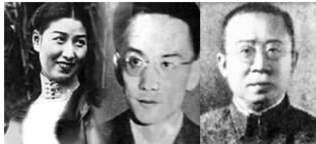
丁默邨(中)之死，与其背负的两件血案脱不了关系，一件为郑苹如(左)案，一件为郁华案

“不要小瞧了这件事，10月10日是南京国民政府的国庆节，1946年可是南京国民政府首都光复后的第一个国庆，越是这样的日子，至上至政府官员，下至平民百姓，越对汉奸恨得是牙痒痒的。这前后几天的报纸都篇幅报道国庆内容，突然来了个‘汉奸丁默邨私通法警，乘车买药回府吃饭’这样的新闻，能不让人震惊并且印象深刻吗？”