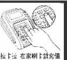
拉卡拉 在家刷卡就充值