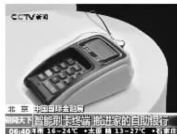
北京 中国银联全球网 《朝闻天下》智能刷卡终端 您家里的自助银行 06:40 南京 16-24℃ + 太阳 13-27℃ + 石家庄

9月16号CCTV《朝闻天下》报道:现如今百姓缴费还款交费难,银行排队久,办理一些日常业务,动辄需要排几个小时长的队。但2010年在北京举行的中国国际金融展上,众多金融工具和产品的出现着实让老百姓看到了希望,其中最亮眼的就是国内最大的线下支付公司拉卡拉推出的家用刷卡终端拉卡拉。 据了解,拉卡拉是中国银联的战略合作伙伴,拉卡拉只需固定电话线的连接,百姓即可在家轻松进行信用卡还款、查余额、水电煤缴费、转账汇款等。在家轻松一刷,1分钟搞定,再也不用去银行排长队,大大节省了百姓的时间和精力。