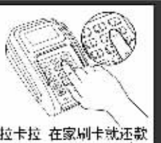
拉卡拉 在家刷卡就还款