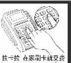
拉卡拉 在家刷卡就交费