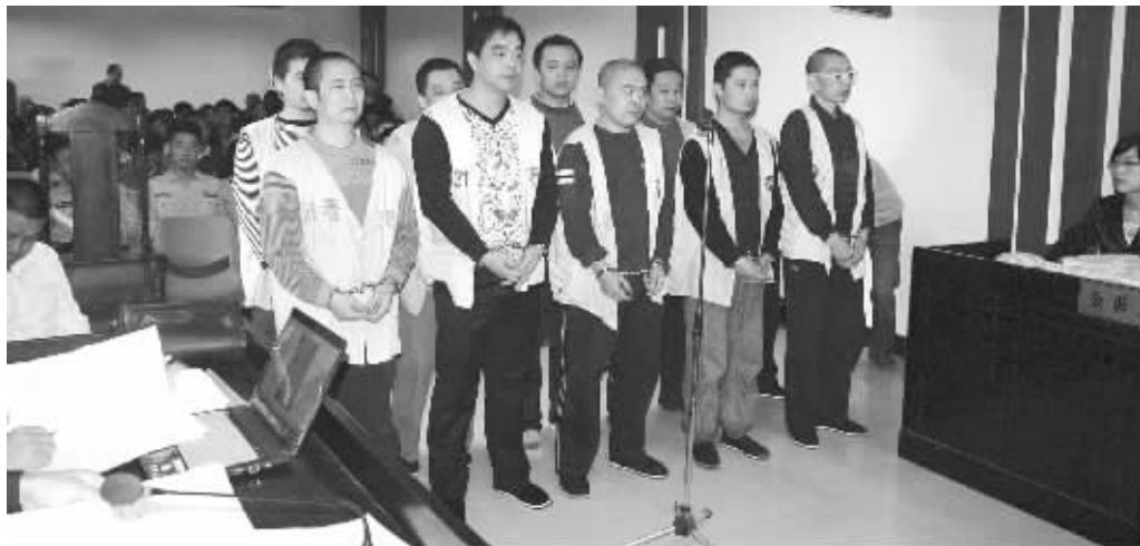
36名被告分批上庭受审