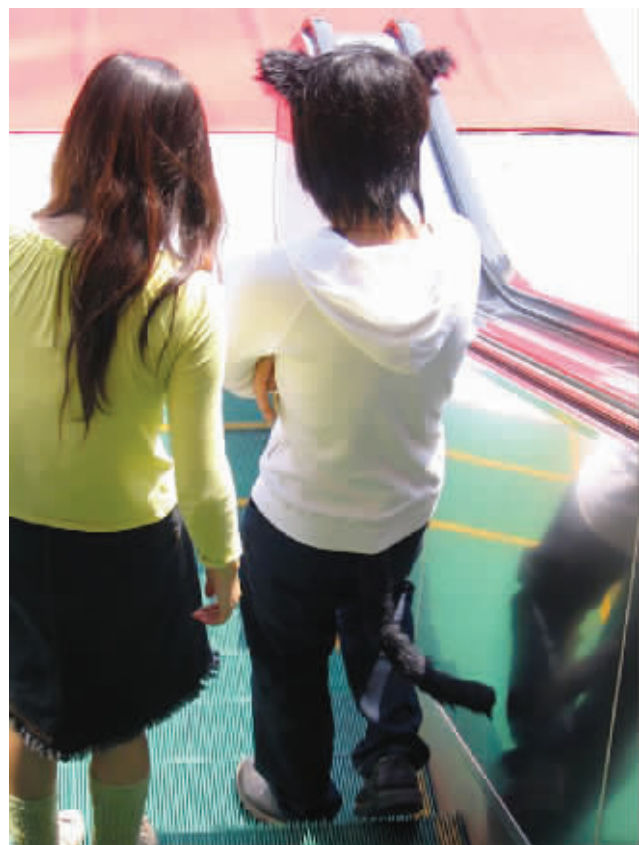
“狼人”携美女从电梯上走下来,尾巴还用夹着的,就不怕被夹着? 摄于龙蟠路 (作者:颜英 获30元话费)