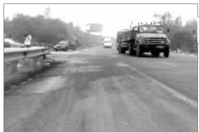
事发路段满地机油