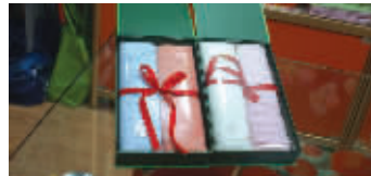
干竹坊竹纤维毛巾礼盒