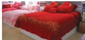
花花公子家纺床品

赶紧行动起来到环北服装批发市场“淘衣服”吧!郁香菲、约瑟芬名店等品牌服饰一应俱全。韩版、瑞丽、嘻哈、淑女等各种款任你挑选,风格时尚且价格实惠!赶紧去挑选一套扮靓自己的国庆假期!见习记者 刘德杰