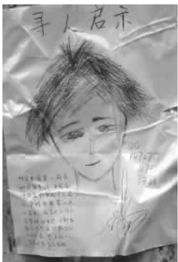
女生高调寻爱