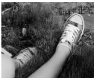
文艺少女拍照,上拍天,下拍鞋