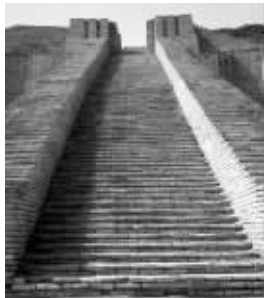
苏美尔人建造的神庙遗址