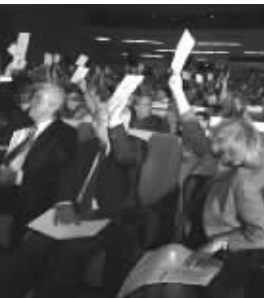
2006年国际天文学联合会投票将冥王星逐出九大行星行列