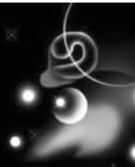
白羊座的人被赋予冲动的性格