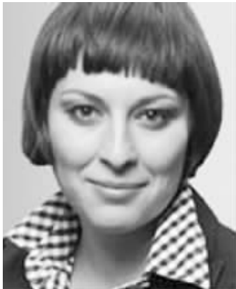
莉维亚·亚罗卡,罗姆裔匈牙利政治家,2004年6月当选为欧洲议会议员。

莉维亚指出,欧洲约80%的罗姆人选择定居而非流浪,关于他们有一些非常“过时的形象”,造成了许多问题。她强调:“人们对罗姆人的印象与实际相去甚远。我和同僚们的工作之一就是尝试还原罗姆人的真实面貌。当人们理解到罗姆人和欧洲其他民族共同点之后,就是罗姆民族实现其价值的时候。”莉维亚解释道,例如匈牙利的旅游形象就与