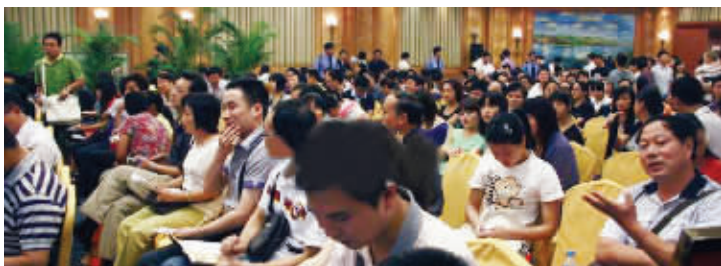
昨天,江宁的融侨世家开盘,卖得十分火爆