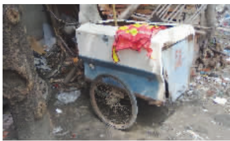
家人说这是马冬梅用过的保洁车