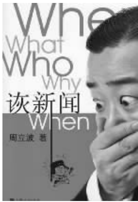
周立波 著 上海人民出版社友情推荐

大家都曾经非主流过,不要因为你觉得自己主流了,就去非议非主流,宽容一些,非主流有一天会成为主流,并且主宰这个世界,也正是因为非主流的存在,我们的世界和社会才更加多彩。