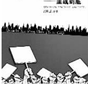
雷坤强 著 北方文艺出版社友情推荐