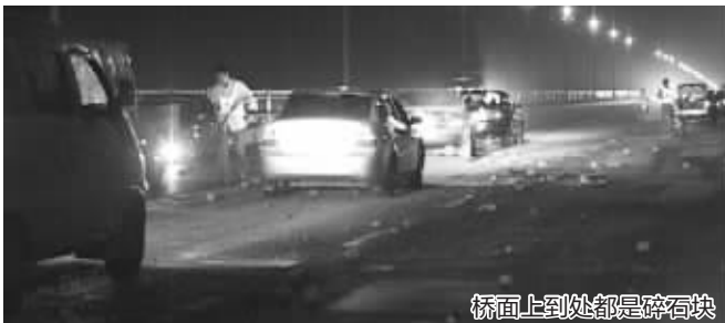
桥面上到处都是碎石块

前晚11点左右, 长江大桥中段200多米长的桥面突然成了“石子路”, 十几辆轿车相继爆胎。