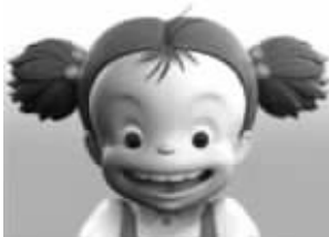
周六: 哇哈哈! 不上班真爽!