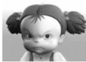
周二: 怎么办?这一周怎么熬啊? 恩! 努力吧!