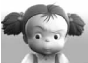
周四: 睁大眼睛,好好工作,坚持下去,坚持就是胜利。