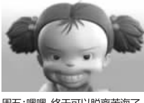
周五: 嘿嘿,终于可以脱离苦海了。