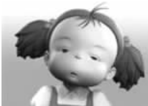
周一: 我的眼睛都睁不开了,浑浑噩噩啊!