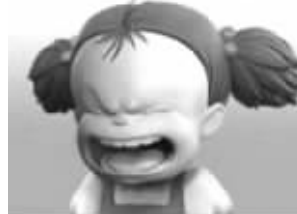
周三: 崩溃崩溃我要崩溃……