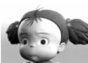
周日: 好日子总是瞬间即逝,焦虑焦虑……