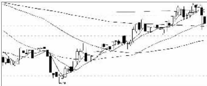
道博股份近期走势

据上述人士吐露,可能遭遇“馅饼”陷阱的个股至少必须具备三大特征:第一、存在某种朦胧预期,比如资产重组或资产注入;第二、实际流通盘一般不能太大,原则上不能超过1亿股;第三、近期成交清淡,