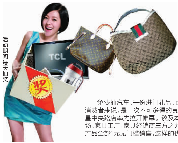
活动期间每天抽奖