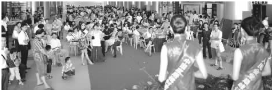
鼎级联盟上一场活动引来满场业主

俗话说,一根筷子易折断,一把筷子抱成团,团结就是力量大。在建材界,“抱团”现象也蔚然成风。继去年南京本土建材联盟——建材阳光八大家成立后,“新八大家”——鼎级联盟也于今年4月悄然成立。业内人士表示,越来越多的建材企业开始加入到“抱团”营销的行列中来,以期获得更大的市场份额。