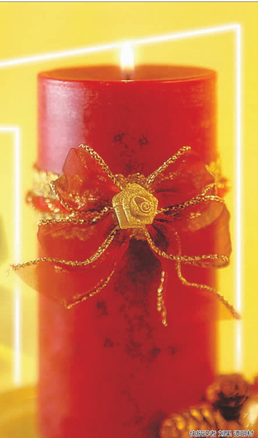
快报记者 刘果 谭明村