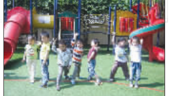
601号柴华正在丢沙包