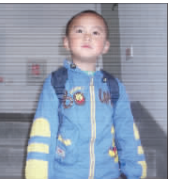
326号文宇屹背书包上学照