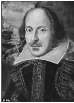
莎士比亚的传统形象