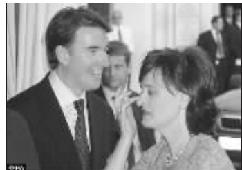
曼德尔森和切丽 资料图片