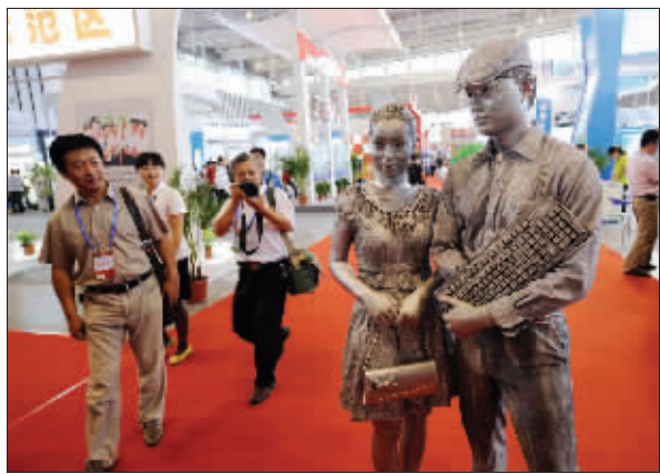
9月3日,两位装扮成雕塑的模特在软博会现场进行电脑与生活主题行为艺术展示。