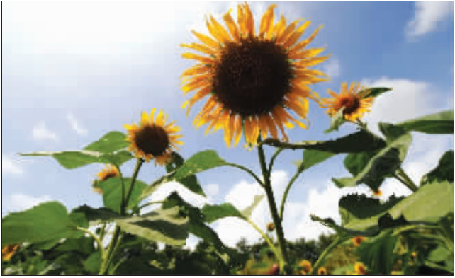
一直到10月份,都有向日葵可以欣赏