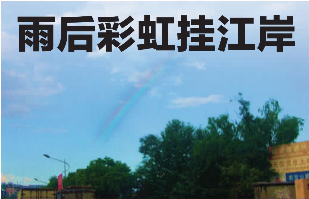
雨后彩虹,因为难得出现,所以看上去更美