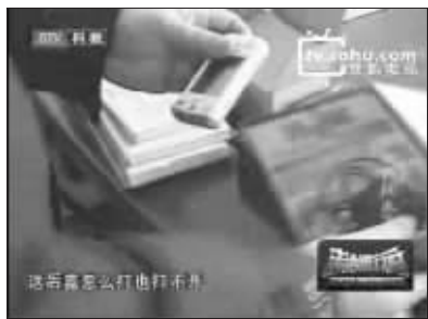
手机后盖怎么也打不开