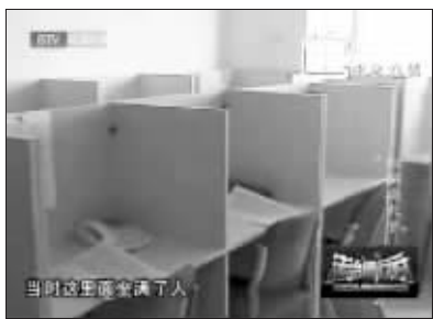
当时这里坐满了人