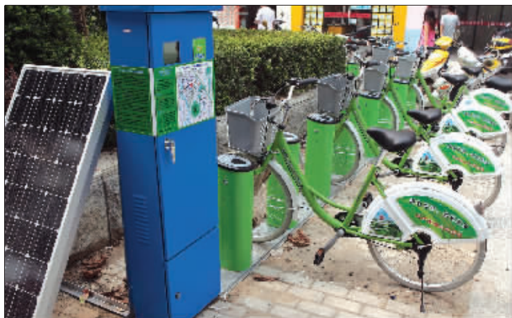
地铁天印大道站旁的公共自行车站点

昨天,记者从江宁区获悉,南京首个公共自行车项目已经开始试运营,虽然很“低调”,但这两天已经有20多位市民办理了公共自行车租赁卡。据介绍,早期优惠,交320元(300元押金+20元预付费)就可办理一张“卡”,在江宁40个点随意借用,每次一小时内免费使用。目前,40个点差不多有30多个点已经安装到位,部分点200辆公共自行车已开始试运营,不过,记者了解到,正式启用大概在9月10日左右。