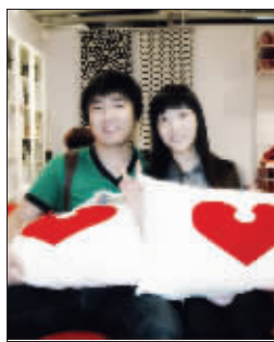
爱情宣言: 我们在一起。 网络投票【52】 | 短信投票【0】