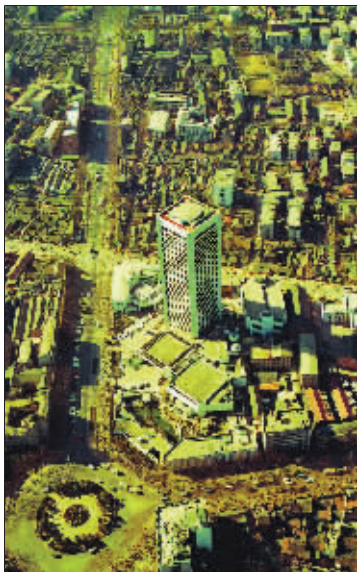
27年前金陵饭店鹤立鸡群