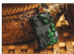
希望(琢之缘 本周斗石宝贝): 墨翠, 俏色作品