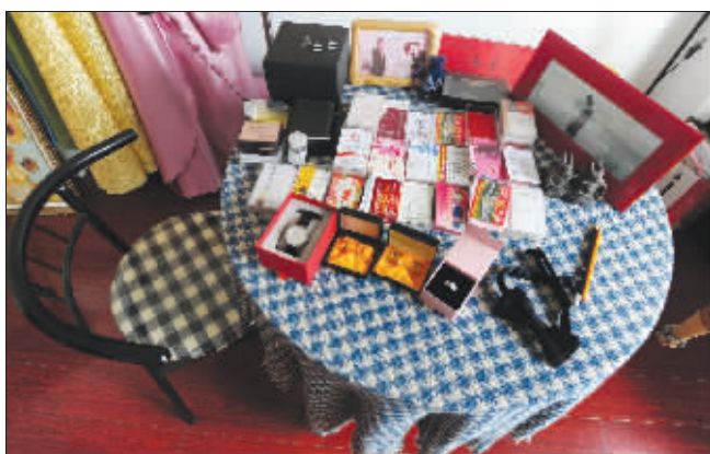
海先生的个性办公桌

办公桌被各种物件堆得满满当当。海先生一一介绍, 里侧的相框是他主持某次婚礼时的留影, 他说这是为新人提供婚礼礼仪的模板, 司仪不仅要站在舞台右侧, 还需与新人保持一个人的距离; 旁边一个蓝色的喜糖袋, 寓意喜庆; 右侧的一个相框, 是一对情侣在海边的背影, 显出浪漫……桌上占据最大空间的是若干个名片盒, 为新人提供婚车、喜糖、婚庆等各个环节的海量资源, 主打实用主义; 另外还