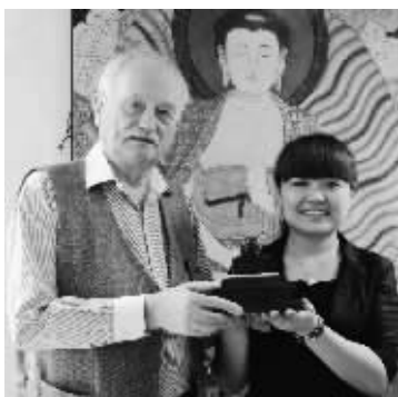
国际友人欣喜珍藏“世博和田玉玺”

首款“世博宝玺·中国印”在我市首发引起轰动,很多人2套、5套、10套购买,不仅自己珍藏,还将世博宝玺送给领导、客户、朋友,祝愿飞黄腾达、富贵吉祥。