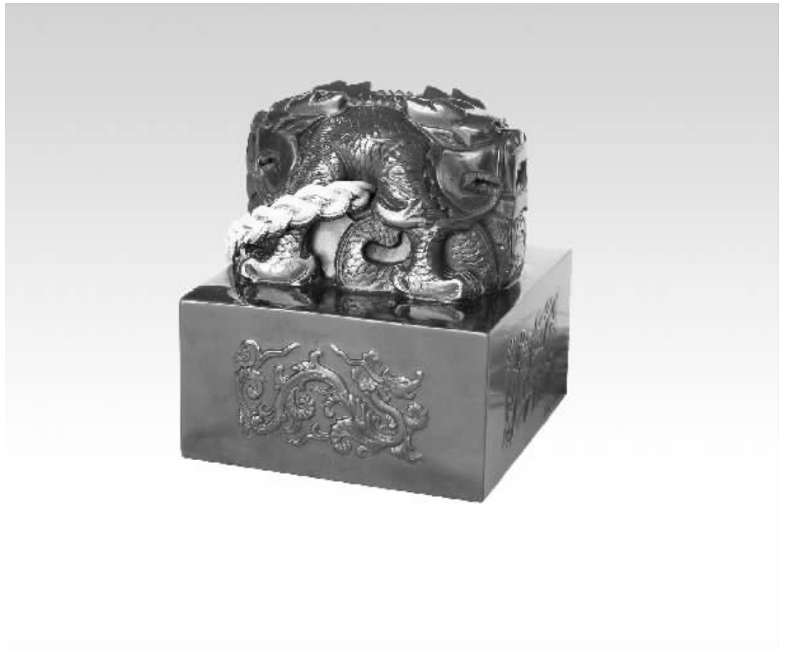
▲宝玺通高8.6厘米,玺钮高5.6厘米,代表56个民族大团圆;龙钮是威猛霸气的盘龙,龙腹穿孔附系黄色绶带,底部正方形印面边长为8厘米,象征中国的四面八方。四面刻有龙、凤、龟、麒麟四大吉祥物,象征龙凤呈祥、健康长寿。印面凸雕篆刻世博会徽,图案形似字“世”,与“2010”巧妙组合,相得益彰。宝玺大气天成,巧夺天工,光耀王者风范!

物以稀为贵,为彰显“世博宝玺”无与伦比的至尊地位和极大的升值空间,全球只发行2010尊,仅供少数幸运藏家荣耀典藏。每尊都雕刻唯一限量编号,以后永不复制。每套均由上海世博局授权方可制造,并配有人民币防伪高科技专造的世博特许标签和国家出具的玉石“鉴定证书”,鉴定结论尊尊均为和田玉。