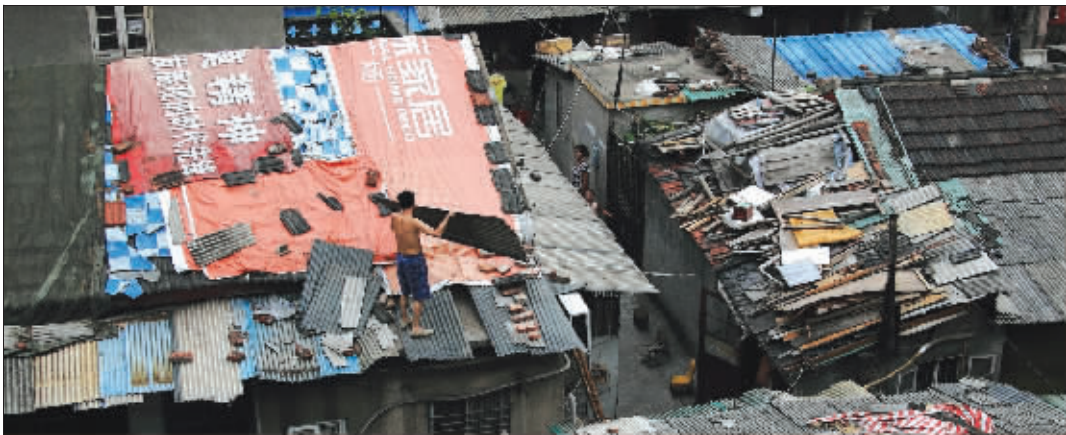
8月24日下午,靠近老江口一侧、东炮台街边居民正在修房顶