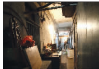
方家营730号院内,昏暗的灯光下——楼道里的集体厨房