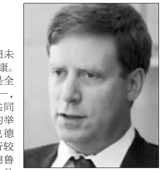
德鲁肯米勒 资料图片

几十年来，德鲁肯米勒一直是全球最成功的宏观对冲基金经理之一，曾获索罗斯邀请，担任量子基金共同管理人长达12年之久。其最著名的举动是在1992年准确预测出英镑兑德国马克汇率将下跌。在与英国央行较量的过程中，索罗斯大获全胜，德鲁肯米勒功不可没。上世纪90年代，他还正确押注欧元的走势。