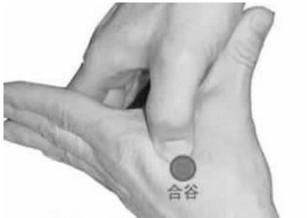
按压合谷穴的确能缓解头痛的症状(资料图片)

突发疾病昏厥时,除了及时拨打120外,还有什么好办法吗?近日,网络上有一篇题为《网传中医六大神奇点穴急救大法》的帖子引起了广泛关注,那么点穴真的能急救吗?专家说,其实说得都有一点道理,但是非专业人士,能真正准确找到穴位施救的人比较少,所以不太适合急救。