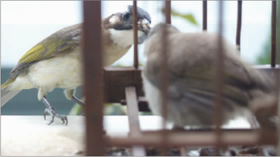
笼外的那只鸟儿仿佛在说,“亲爱的,我会天天飞来和你,让你天天过七夕。”两只鸟儿的爱情,能否感动鸟笼的主人?摄于下关煤炭港。(作者武家敏 获30元话费)