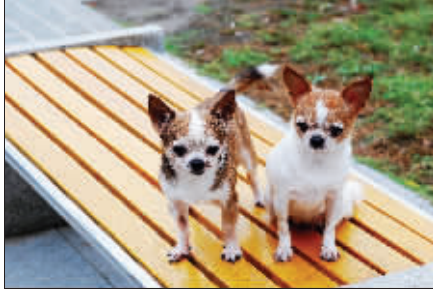
亲爱的,今天是七夕,我们拍张照留念吧。8月16日摄于玄武湖。(作者陆如 获30元话费)