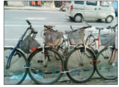
哥四个手挽手,与小偷斗一斗。8月14日摄于新民路。