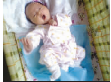
吃了奶,浑身是劲。哼哼哈哈,练几招给妈妈看看。(作者赵琳 获30元话费)