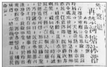
1930年8月17日,《中央日报》上刊登了《警察厅再禁河塘沐浴》的新闻

本月10日晚9时许,南京市江宁区百家湖,一名23岁的小伙子不幸溺亡。几乎每到夏天,天然的水源就成为许多市民的避暑佳地,但悲剧也一再发生。就算是在80年前,这样的事情也比皆是。这不,1930年8月17日的国民政府《中央日报》上,就刊登了《警察厅再禁河塘沐浴》的新闻,文章说,“首都警察厅长吴思豫,前以时届夏令,天气炎热,本市区内各处水池河塘,每见有无知市民,任意沐浴……曾经通令所属,加以取締在案,乃时逾多日。近查各局界内,仍不时有前项情事,殊关有违功令,致碍卫生,特于昨日重申前意,再令各警局,转饬所属,一体严行查禁,以重人命云。”民国南京究竟有多少池塘?民国南京警察厅颁布的这则禁令,能杜绝市民池塘游泳吗? 本版主笔 快报记者 张荣