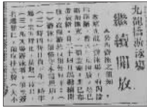
1930年8月23日的《中央日报》,在同一版面上登出了这两则新闻