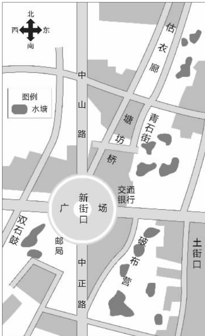
1934年,南京仅新街口一带,就有15个池塘(根据1934年的南京地图绘制) 制图 李荣荣

池塘里不断有市民遭受“没顶之灾”,引起了国民政府相关方面的注意,正如记者在《中央日报》上看到的那样,警察厅一再颁令,禁止在河塘“沐浴”。为了解决市民避暑问题,当局决定多开放游泳池,这样既卫生,又安全。那么,在游泳池游泳,果真就安全吗?