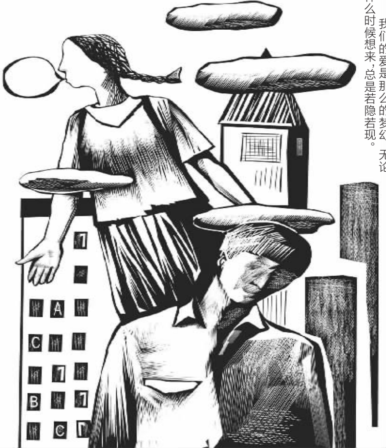
绘图/鲁嘉 插画师 美国SND插图奖获得者 已婚