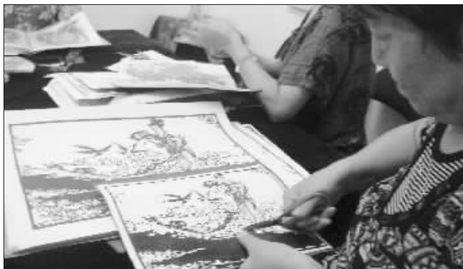
我把爱剪出来送你