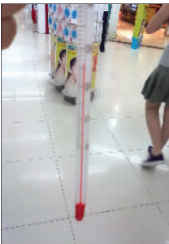
东方商厦负一层26℃